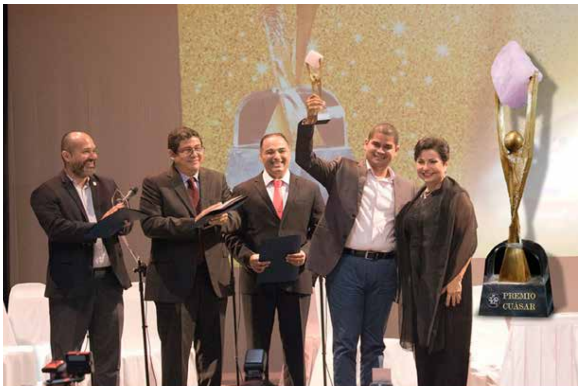
Gala Científica, Premio al Investigador del Año.

En este primer semestre del año en curso, se han realizado 4 ciclos de conferencias virtuales en los que destacados investigadores de la UTP, así como investigadores invitados han expuestos a la comunidad universitaria los resultados de sus investigaciones.