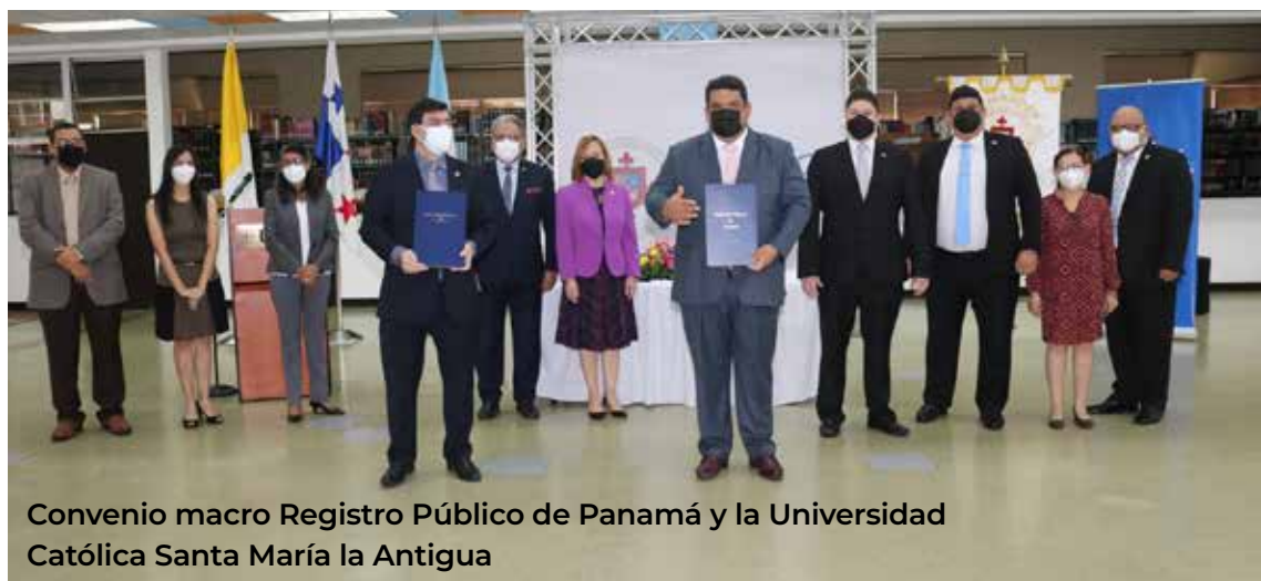
Convenio macro Registro Público de Panamá y la Universidad Católica Santa María la Antigua

- Investigadores Asociados: el 02 de junio de 2021 se realizó el Acto de Proclamación de Investigadores Asociados, donde se asociaron dieciocho (18) nuevos miembros y siete (7) renovaron su membresía. Dicha figura fue adoptada por la Dirección de Investigación de la Universidad Católica Santa María la Antigua (USMA) a partir del año 2013 como una de las estrategias para fortalecer la capacidad del recurso humano disponible para desarrollo de actividades de investigación.