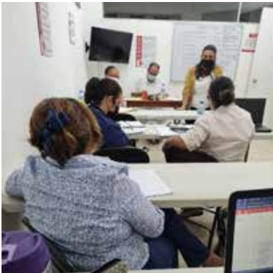
Convocatoria para Investigación a Facilitadores de Sede Y Centros Asociados,2021

UNADP y su Centros Asociados convocaron desde el mes de mayo del 2021 a sus facilitadores para motivarlos a realizar investigaciones, que se encuentran en fases de desarrollo y que deben concluir en los meses de septiembre y octubre del presente año.