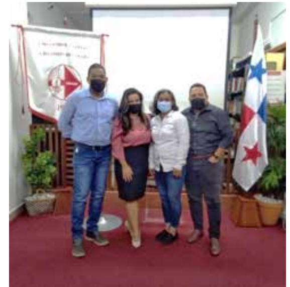
Comité Consultivo de UNADP, 2021

El Comité Consultivo, encargado de la recepción, selección y corrección de la revista SCIRE 2021 labora para que cada uno de sus artículos cumpla con los objetivos de permitir reflexiones en todos sus lectores, con fines de fortalecer conocimientos en tiempos tan cambiantes como los actuales.