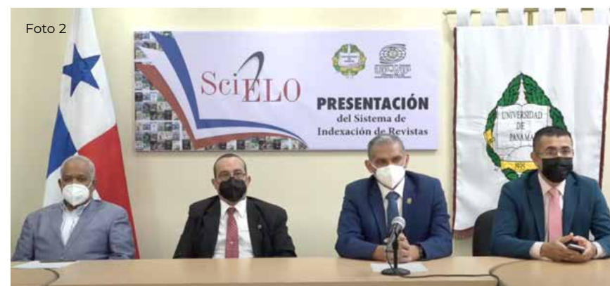
FOTO GRUPAL: Equipo de la Oficina de Publicaciones Académicas y Científicas de la Universidad de Panamá

Se han gestionado tres proyectos importantes y de carácter histórico no solo para Panamá, sino para la región, como lo son: El primer indexador panameño: Panindex, lanzamiento que tuvo lugar el 26 de marzo; plataforma creada con el objetivo de elevar la calidad de la producción editorial en todas las áreas del conocimiento y fortalecer la