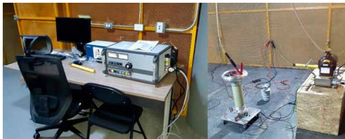
.Laboratorio de Ensayos Eléctricos y Alta Tensión (LEEAT).