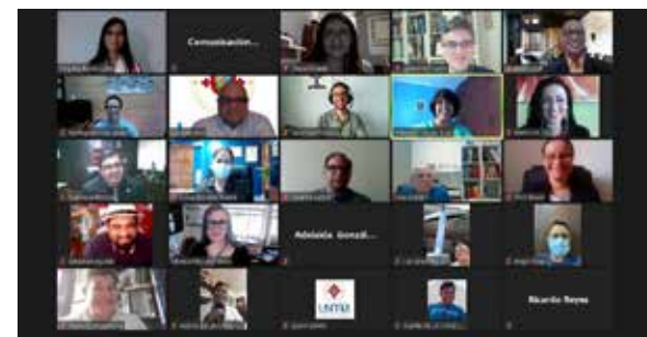
Acto Virtual de Proclamación de Investigadores Asociados de la USMA.

- Revista de Investigación y Pensamiento Crítico: la Revista IPC indexada en Lantindex 2.0 y AmeliCA, el día 11 de junio de 2021 fue incluida en la Red Iberoamérica de Innovación y Conocimiento Científico REDIB, es una plataforma de agregación de contenidos científicos y académicos en formato electrónico producidos en el ámbito iberoamericano, ofrece a sus usuarios acceso directo a documentos científicos y académicos de calidad contrastada, publicados por editores y otros productores de contenidos científicos y académicos, de países, temática e idiomas iberoamericanos. El último número de la revista Vol. 9 Núm. 2 (2021) fue publicado el